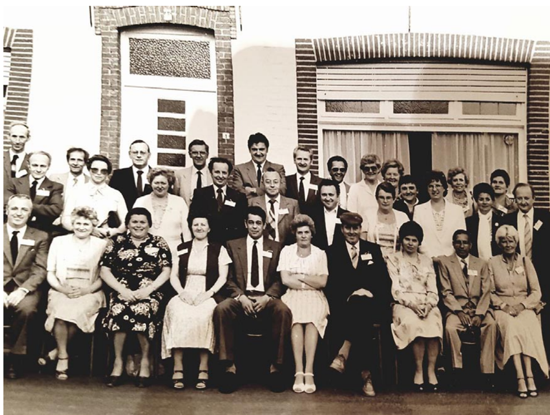
1985. De 50-jarigenviering in Den Tivoli.