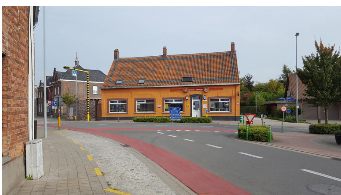
Situatie in 2018