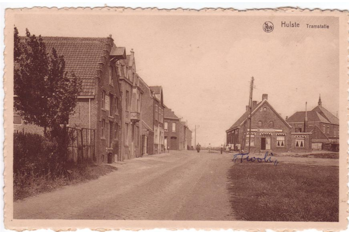
Ongedateerde prentbriefkaart. Hierop is te zien dat er ook in de zijgevel een toegang tot het café was.