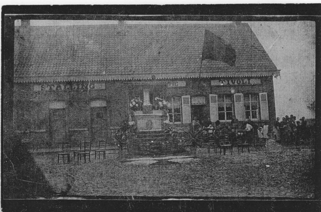
Foto (ongedateerd) van In den Tivoli met een tijdelijk altaar midden de straat. Dit naar aanleiding van een processie. In 1910 wordt het café verbouwd. De gelagzaal wordt vergroot met het linkse gedeelte van het gebouw.